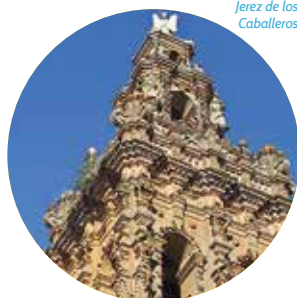
Jerez de los Caballeros