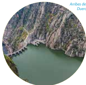
Arribes del Duero