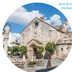
Jerez de la Frontera