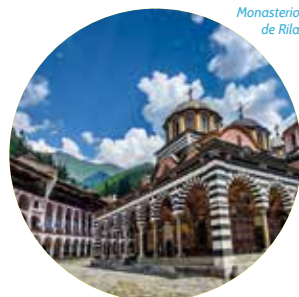
Monasterio de Rila

INCLUYE: asistencia en el aeropuerto de Madrid (origen zona centro) • Vuelos desde Madrid y Málaga (tasas incluidas) • Guía acompañante en destino • 20 comidas: según itinerario, empezando el día 1 con cena o cena fría (en función de la hora de llegada) y finalizando el día 8 con desayuno (agua mineral en almuerzos y cenas) • Visitas panorámicas: Sofía, Plovdiv y Veliko Tarnovo; Monasterio de Rila y Monasterio de Bachkovo • Seguro de viaje.